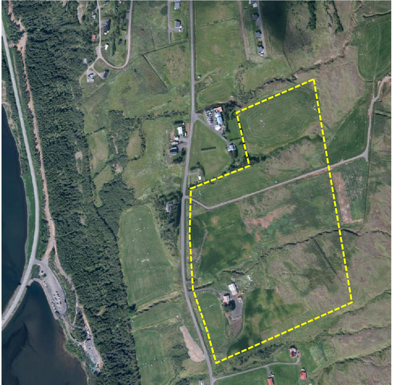
Mynd 1. Skipulagssvæði deiliskipulagsins er afmarkað með gulri línu.