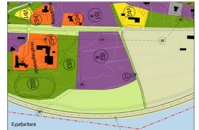
AÐALSKIPULAG EYJAFJARÐARSVEITAR 2005-2025 1:10.000