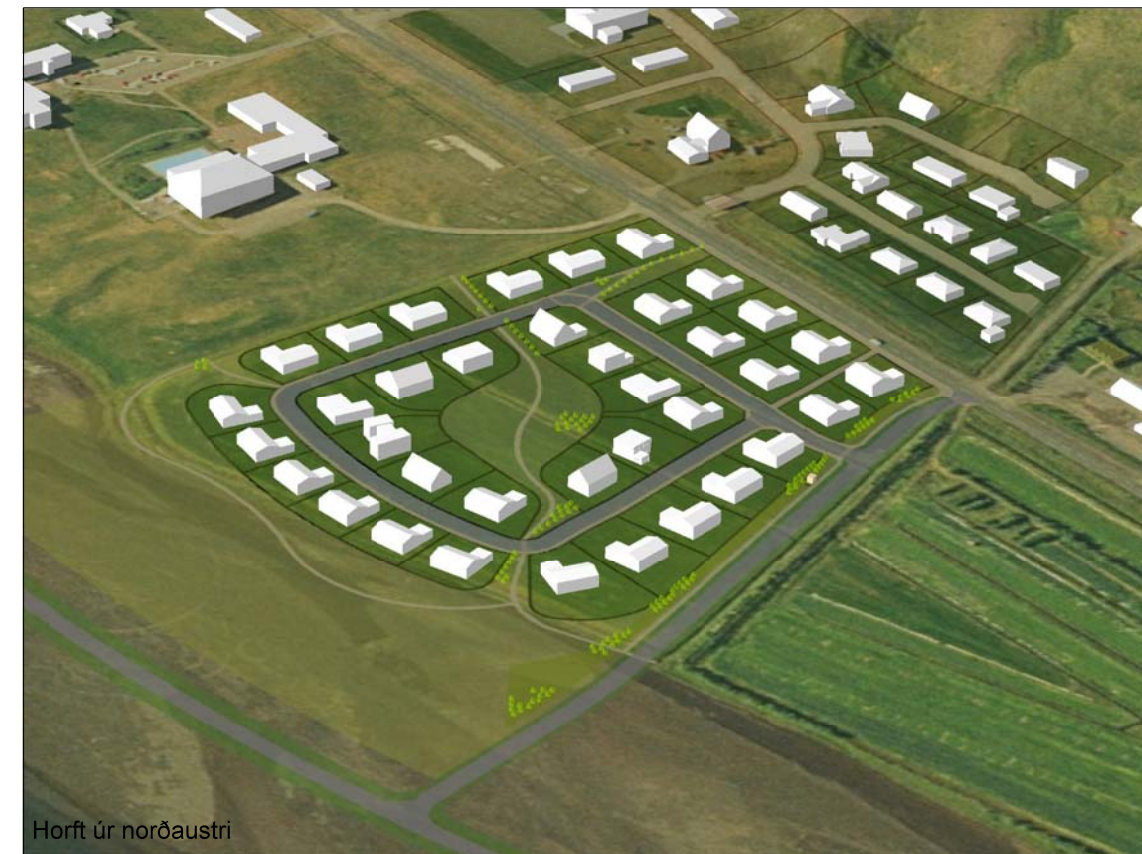
Horft úr norðaustri