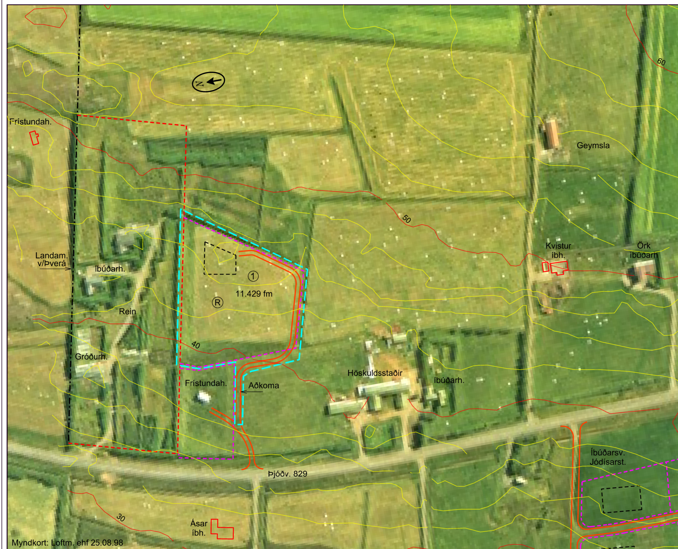
Deiliskipulagstillaga - mkv. 1:2000